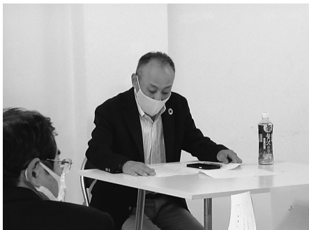
議長を務める片山副理事長